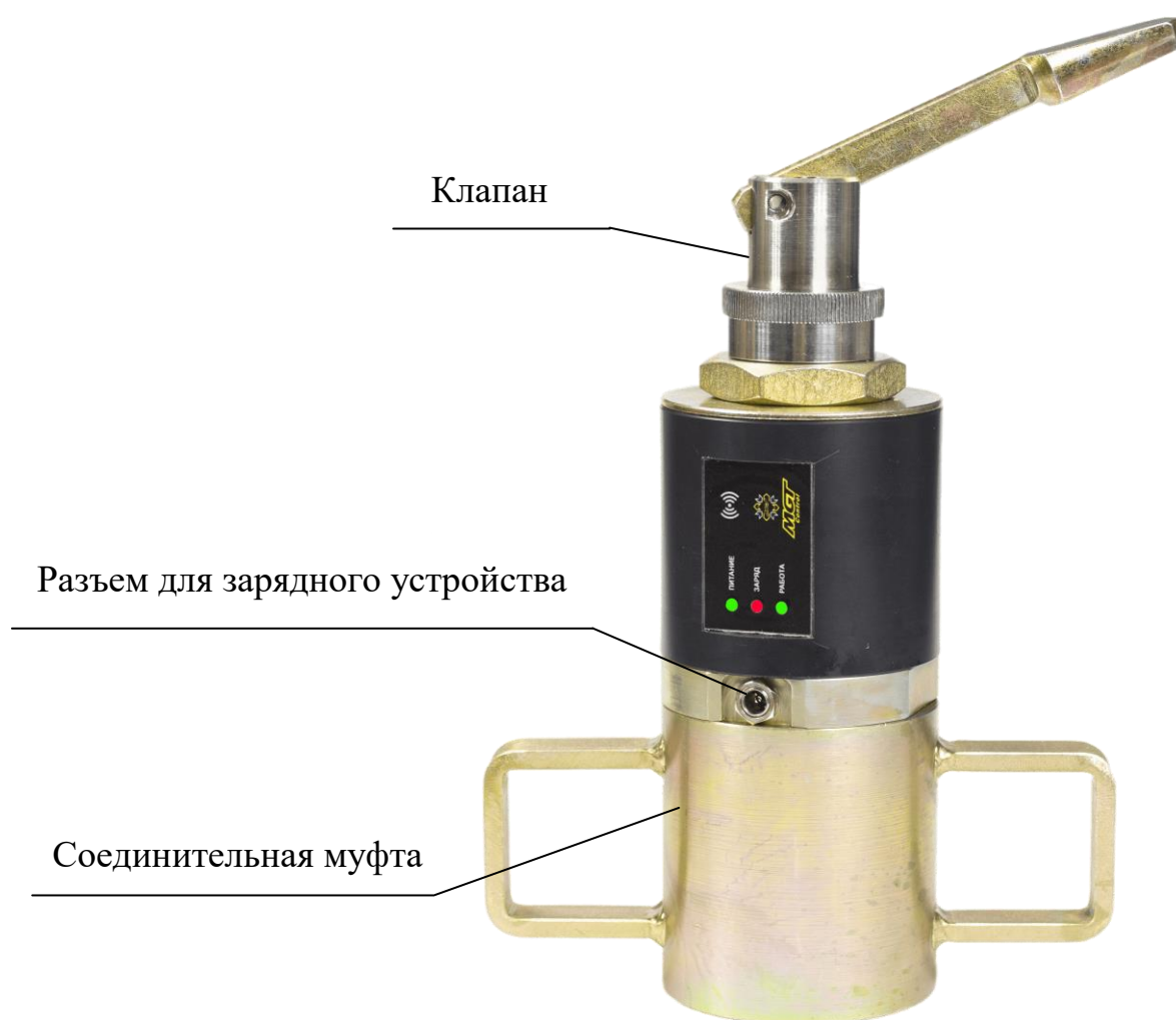
Рис. 1 – Датчик уровня MGT ПДУ-1

Датчик имеет ручной клапан, предназначенный для создания акустического импульса и для выпуска газа из датчика при его демонтаже.